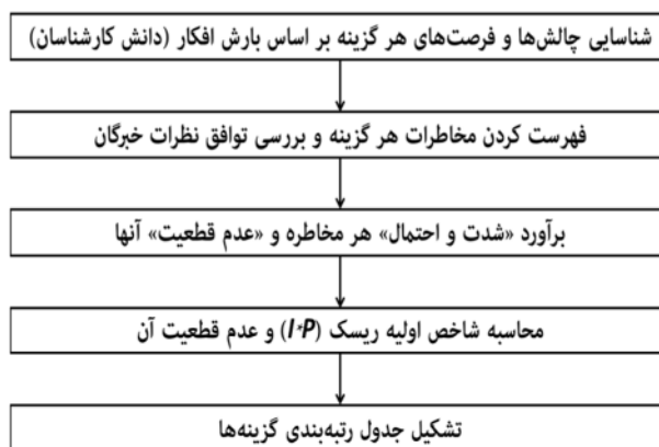
شکل ۲. چارچوب تحقیق تهیه و ترسیم: (نگارندگان: ۱۳۹۵)

مراحل انجام پژوهش در شکل (۲) نمایش داده شده و سپس روش به کار بسته شده در هر قسمت تشریح شده است.